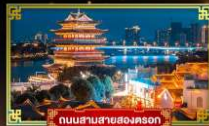
ถนนสามสายสองครอก